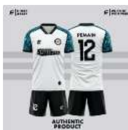
Gambar.2.3. kostum

Pada umumnya para pemain menggunakan Pakaian olahraga longgar agar tidak mengganggu Gerakan, sebagian besar kostum terbuat dari Bahan kain dan celana pendek .