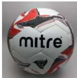
Gambar.2.2. bola

Bola biasanya terbuat dari kulit dengan garis lingkaran Antara 62-64 cm berat bola 0,4-0,44 kg.