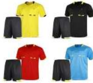
Gambar.2.1 Kostum wasit futsal